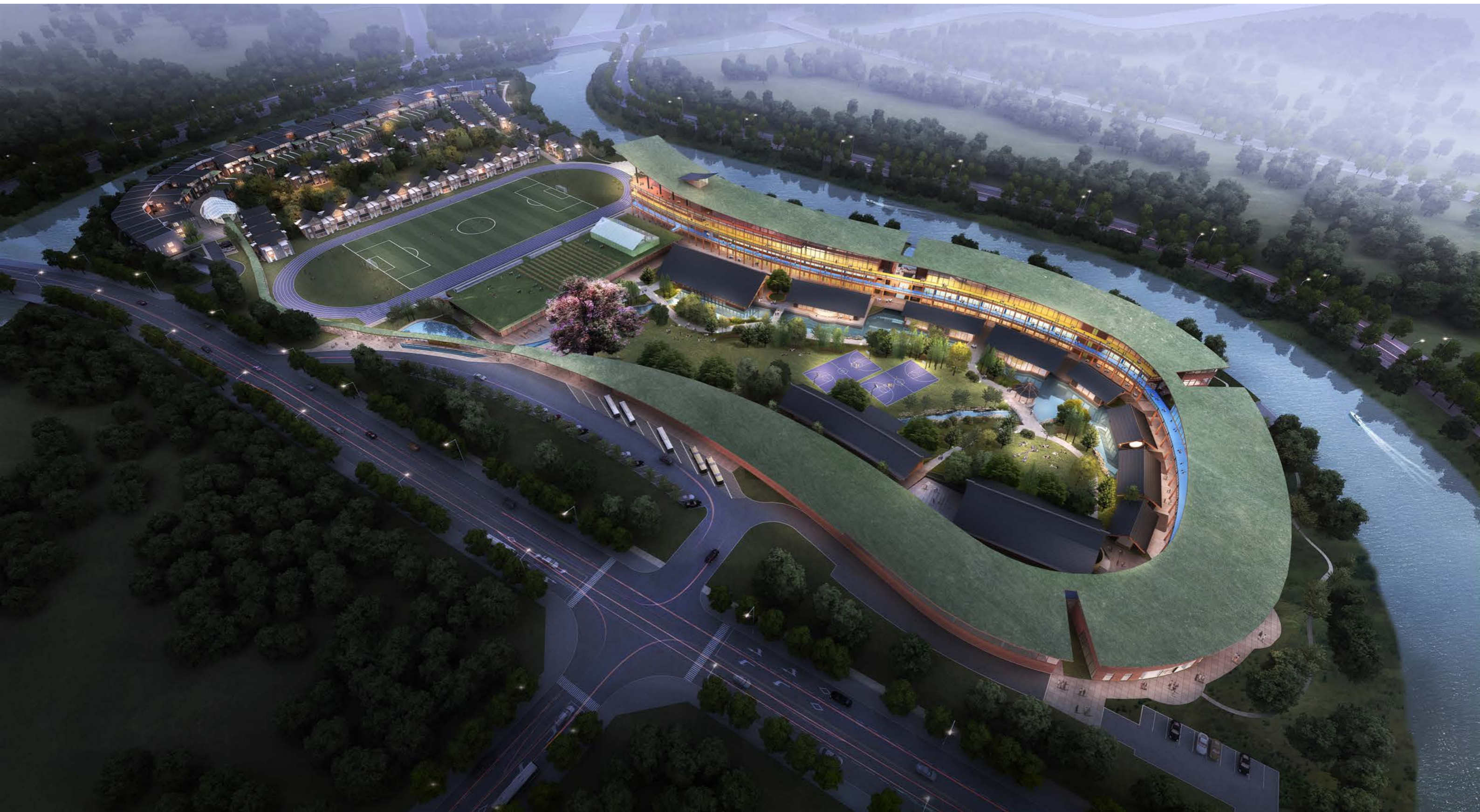
校园夜景总体鸟瞰