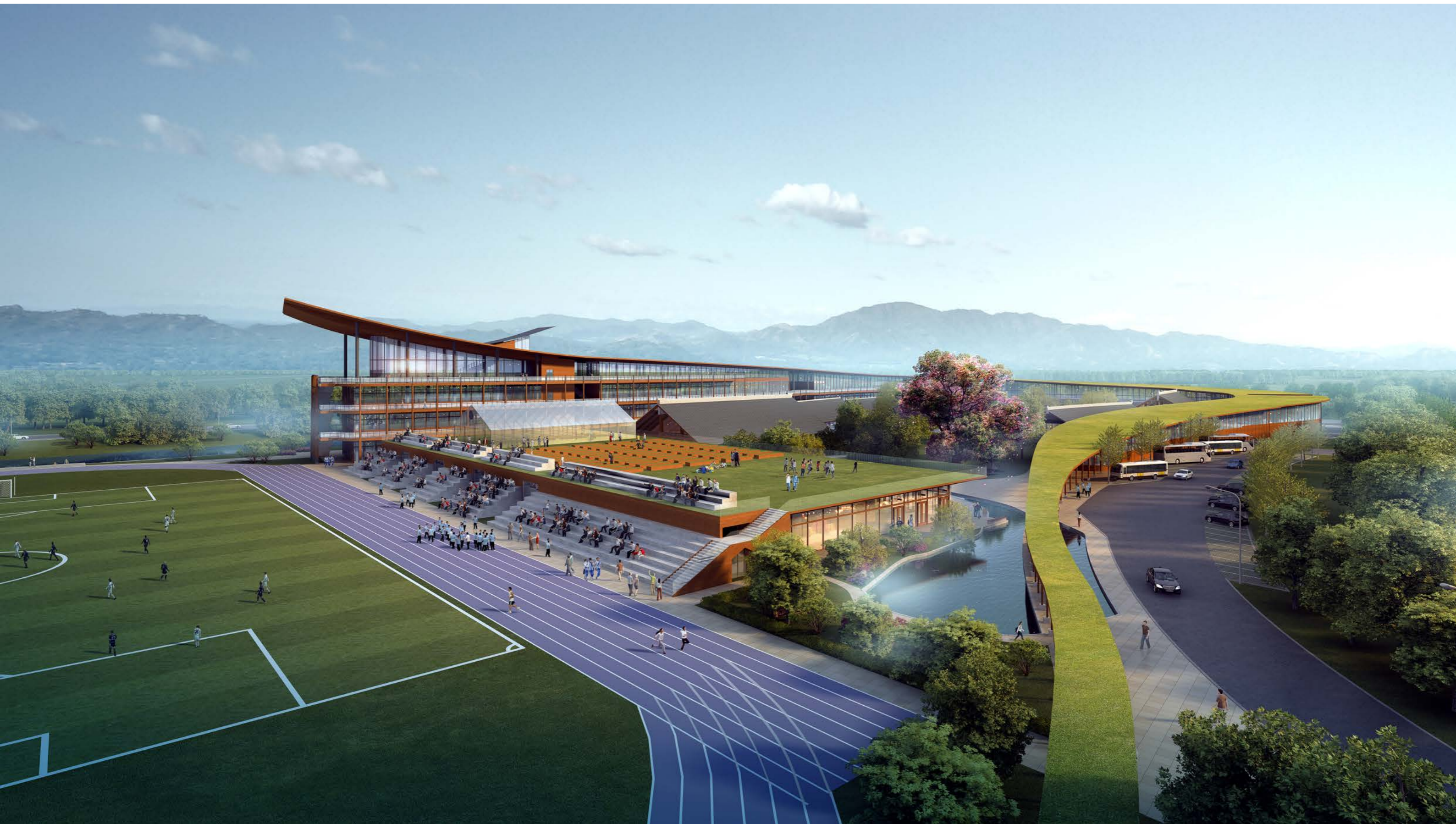
体育场及校园入口鸟瞰